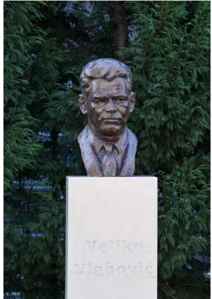
Bista Veljka Vlahovića, postavljena u kampusu Univerziteta Crne Gore 2016. godine

Studijska godina organizuje se u dva semestra (zimskom i ljetnjem). Realizacija studijskog programa u jednom semestru traje 15 nedjelja.