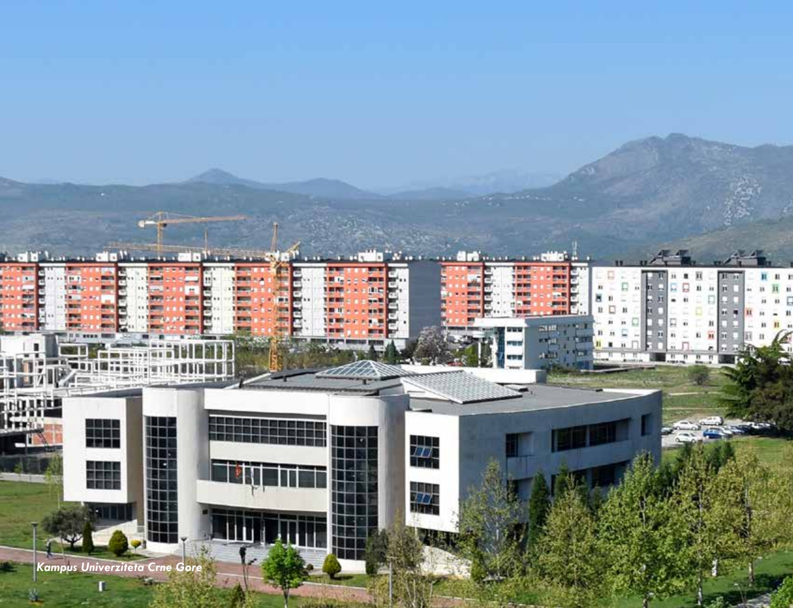
Kampus Univerzitetu Crne Gore